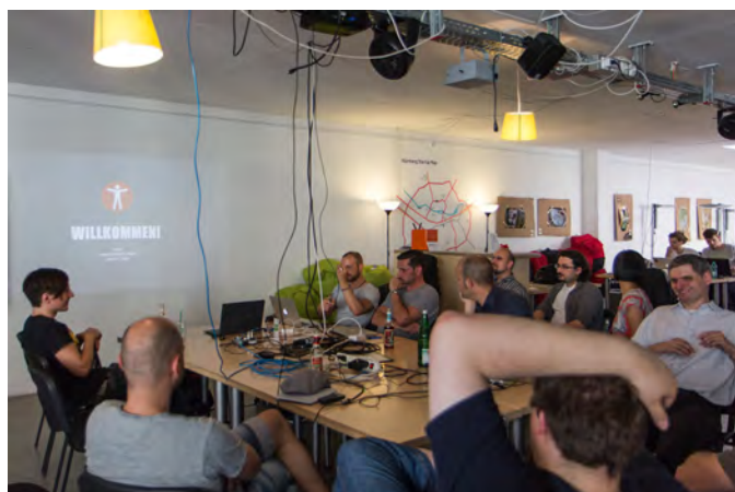
Teilnehmer des Accessibility Club #1 im Juli 2014

Viele der üblichen Teilnehmer arbeiten selbst in prominenten Positionen namhafter Unternehmen.